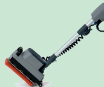
einfacher Transport, dank Transportrollen